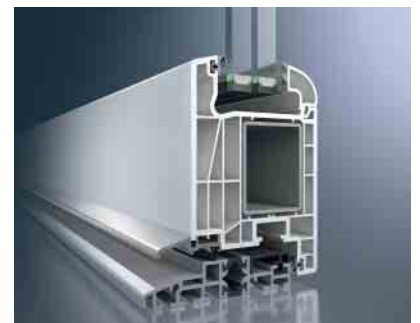
Thermo 6-Haustür mit barrierefreier Türschwelle aus thermisch getrenntem Aluminium

Für hochfrequentierte Ein- und Austrittsbereiche empfehlen wir die barrierefreie Türschwelle aus thermisch getrenntem Aluminium.