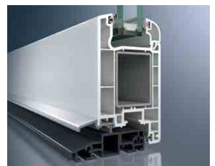
Schüco Corona CT 70 Haustür mit barrierefreier Türschwelle aus Kunststoff